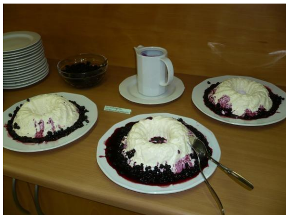
Islantilainen rahkaherkuu skyr