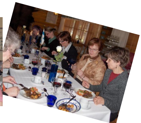
Hangossa Russarön majakalla, eduskunnassa sekä Marskin majalla