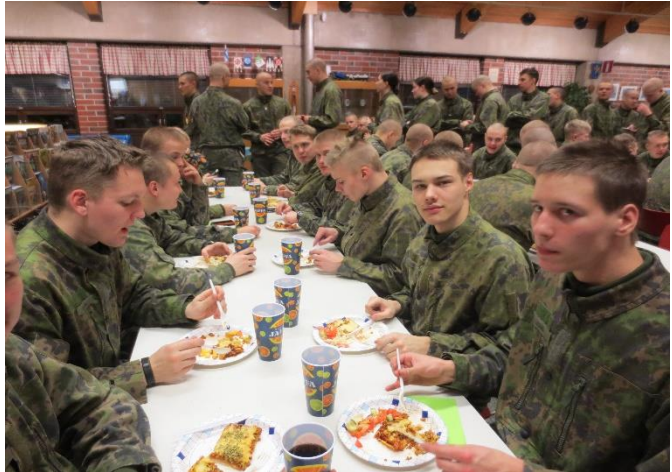
Pizza maistuu ja syödä saa niin paljon kuin jaksaa

Varusmieskyselyt ovat osoittaneet, että jokavuotiset pizzaillat ovat ehdottomasti suosituin tapa tukea varusmiesten virkistystä – aivan kuten menneinäkin vuosina. Kun palautteessa luki "helvetin hyvää pizzaa" saatoimme tulkita onnistuneemme tavoitteessamme. Olemme järjestäneet myös peli- ja bingoiltoja, ostaneet lippuja paikallisten urheiluseurojen otteluihin. Sohvia on uusittu niin sotilaskotiin kuin ajotoimistoonkin, pelikonsoli hankittu kuten pelejäkin. Yhteistyössä Maa- ja kotitalousnaisten kanssa on järjestetty "Pure perunaa" ja "Porkkanalla painat pidempään" sekä smoothie info- ja maistiaistilaisuuksia.